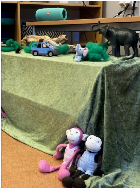
Monki og Minki er med på samlingsstund