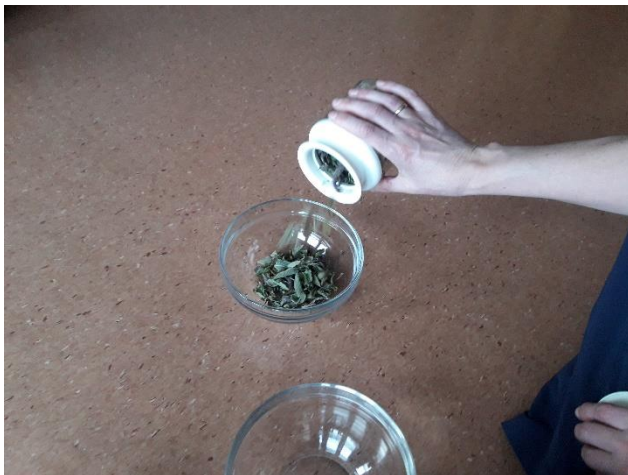
Vi smaker på te fra Sri Lanka

Når prosjektet begynte å nærme seg slutten, ønsket vi å være en god venn, takket for besøket og fulgte apekattene og elefanten på flyturen tilbake til Sri Lanka.