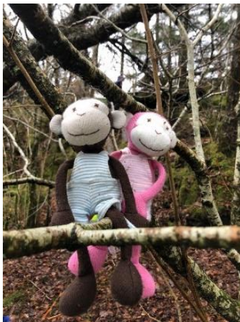
Monki og Minki

Barnegruppen har vært delt i to, Bringebærgruppen og Blåbærgruppen. Vi har hatt faste voksne med i begge gruppene, noe som både sikrer progresjon og stabilitet. VI har arbeidet i smågrupper og det er blitt utarbeidet planer for prosjektet som har blitt samkjørt i en felles ukeplan på basen.