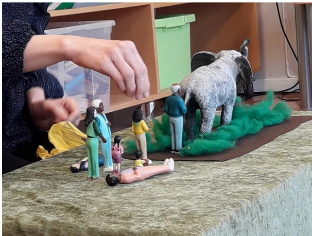
Samlingsstund med historien om den magiske elefanten

Vi har også øvd oss på å telle til ti på tamilsk. En dag vi skulle ut på flytur rope flyvertinnen opp numrene fra en til ti på Tamil. Barna gikk ombord med et stort smil, de synes det var morsomt å uttale tallordene fordi de lignet veldig i uttalen på hverandre.