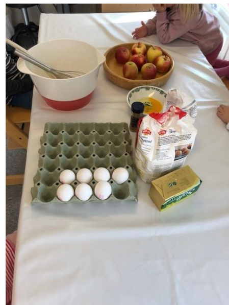
Vi lager eplekake til markedet