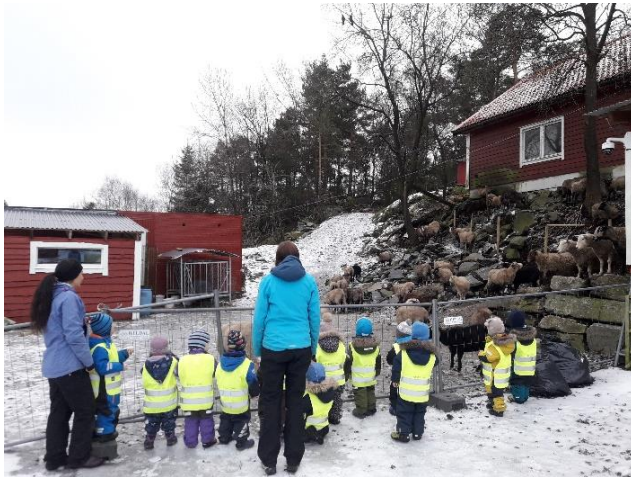
Tur til gården

Vi har snakket om hvor fint det er å ha en god venn, som kan hjelpe, trøste og vise omsorg for hverandre. Dette har vært områder som vi har jobbet med i hverdagen gjennom hele dette prosjektet.