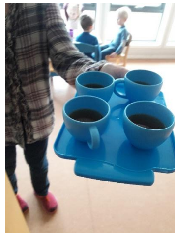
Te klar til servering